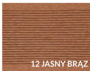
12 JASNY BRĄZ