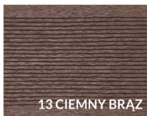
13 CIEMNY BRĄZ